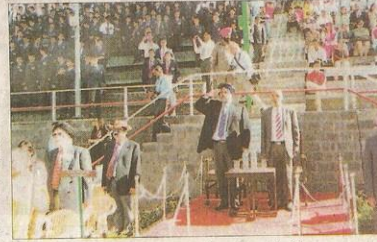
मुख्यातिथि व प्रिंसिपल परेड को सलामी लेते हुए।

पंजाब सरकार के उप मुख्यमंत्री सुखबीर सिंह बादल वीरवार को देश के प्रतिष्ठित लॉरेंस स्कूल सनावर में अपने बचपन के स्कूल में बतौर मुख्यातिथि पहुंचे। इस दौरान उनके संबोधन में निकले पहले कुछ शब्दों से स्कूल में आए दुनियाभर के मेहमानों के मुंह से हंसी के टहाके निकले। मैं जिंदगी में पहली बार किसी मंच पर खड़ा होकर भावुक हुआ हूँ, यह किसी मंत्री के मुंह से सुनना शायद किसी को भी नहीं पचा और खुद मुख्यातिथि सहित सारी भीड़ हंसने लगी। सुखबीर सिंह बादल ने कहा कि वह गौरवान्वित महसूस करते हैं कि वह एक स्नॉरिथिन हैं। यही वह स्कूल था जिसने उनकी नींव मजबूत बनाई और इस ओहदे तक पहुंचाया। सुखबीर सिंह बादल स्कूल से वर्ष 1980 में उत्तीर्ण हुए हैं। उनके मुताबिक स्कूल आज भी 32 वर्षों बाद ज्यों का त्यों ही है।