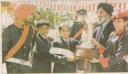
मुख्यातिथि सुखबीर सिंह बादल छात्रों को पुरस्कार देते हुए