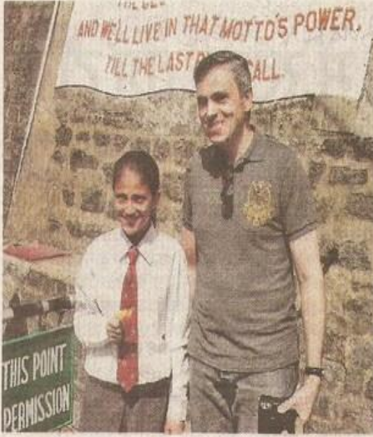
सोलन के सनावर स्कूल के 165वें वार्षिक समारोह में भाग लेने पहुंचे जम्मू-कश्मीर के मुख्यमंत्री उमर अब्दुल्ला बुधवार को स्कूल की छात्रा के साथ।