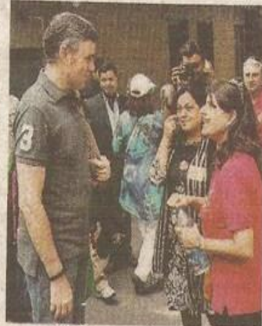
दोस्तों से गुपतगू करते उमर अब्दुला।