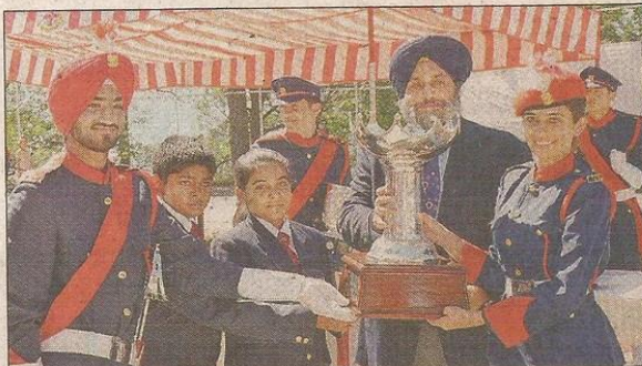
लॉरेंस स्कूल सनावर में छात्रों को सम्मानित करते पंजाब के उप मुख्यमंत्री सुखबीर सिंह बादल।