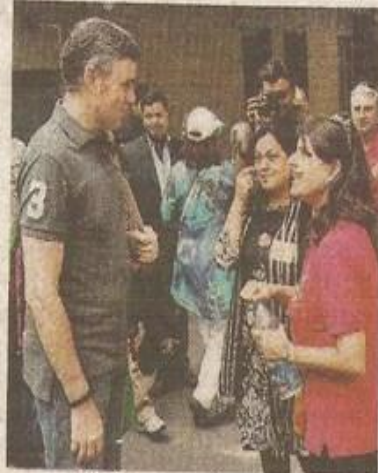
दोस्तों से गुपतगू करते उमर अब्दुला।