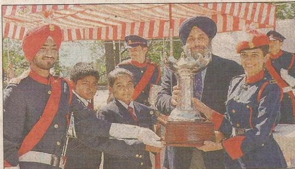
लॉरेंस स्कूल सनावर में छात्रों को सम्मानित करते पंजाब के उप मुख्यमंत्री सुखबीर सिंह बादल।